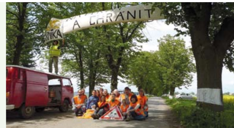
rozšířená místa (výhybny) a kmeny stromů opatřit bílým nátěrem pro lepší orientaci řidičů při zhoršené viditelnosti

Rozhodnutí o zpamátnění aleje předcházelo další posudek, který vypracoval samotný Krajský úřad Kraje Vysočina. Také tento posudek alej ohodnotil jako velmi cennou, zdravou a vitální. Doporučuje ji prohlásit památkou, a když kácet, tedy jen jednotlivé nemocné stromy. Pro zlepšení bezpečnosti provozu na vozovce navrhuje zpracovatel Ing. Krejčí na uvolněných místech zřídít